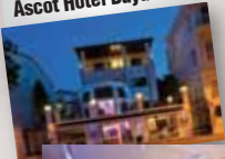
Ascot Hotel Büyükkada